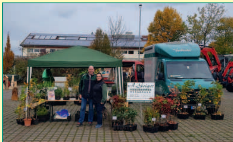
Holztag Scheinfeld 2022