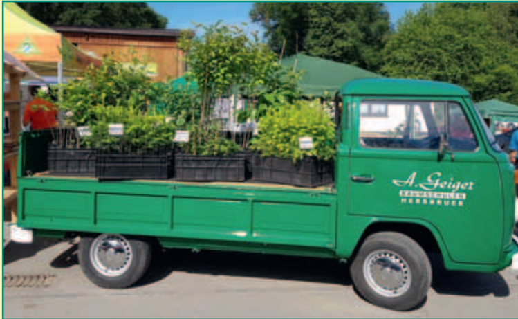
Jubiläumsveranstaltung WBV Fränkische Schweiz